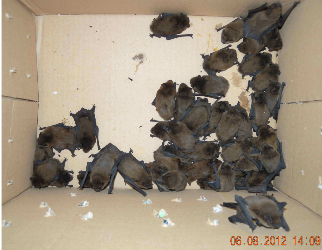
Teilzahl von 204 Zwergfledermäusen nach dem Einflug in ein Bürogebäude.